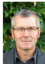
Von Jürgen Mück

Die Ausbildung schließt mit dem Facharbeiter*innenbrief im „Betriebs- und Haushaltsmanagement“ und der Mittleren Reife ab. Zudem können zahlreiche Zusatzqualifikationen, wie beispielsweise die Basisausbildung für medizinische Assistenzberufe, erworben werden.