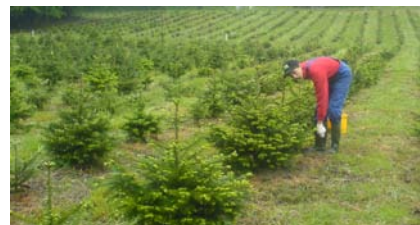
Die Anlage in Frühjahr bei Austriebsbeginn

Bei einer mittleren Austriebslänge von 5 cm wurde die 5-jährige Kultur Ende Mai 2009 mit der Zange behandelt. Drei Reihen wurden von der Behandlung ausgenommen. Aus diesen Reihen wurden nach Vegetationsschluss 50 hinsichtlich Baumlänge und Terminaltrieblänge fehlerlose Bäume vermessen und 50 ebensolchen Zurückgeschnittenen gegenübergestellt.