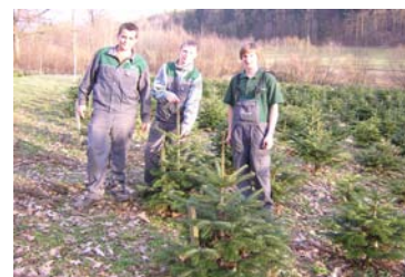
Die Kultur nach Vegetationsabschluss